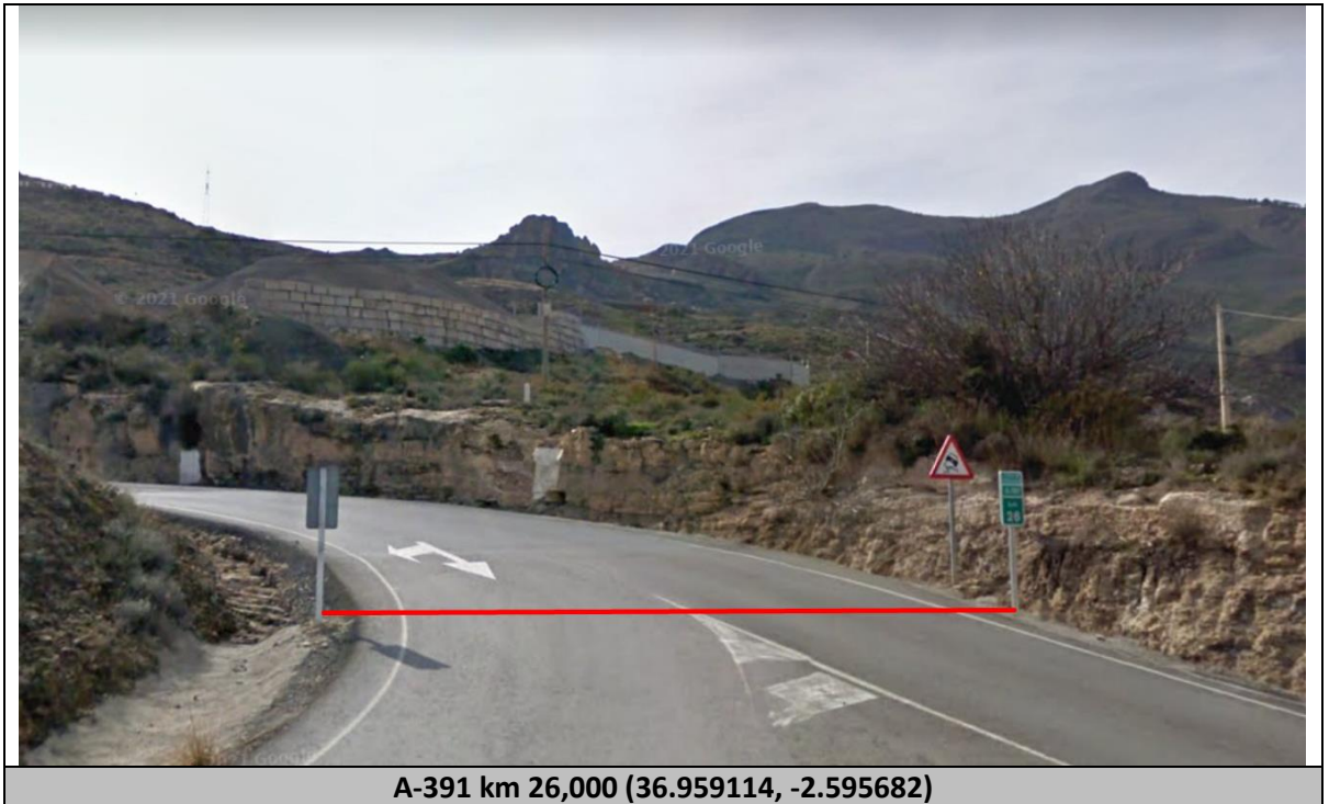
A-391 km 26,000 (36.959114, -2.595682)