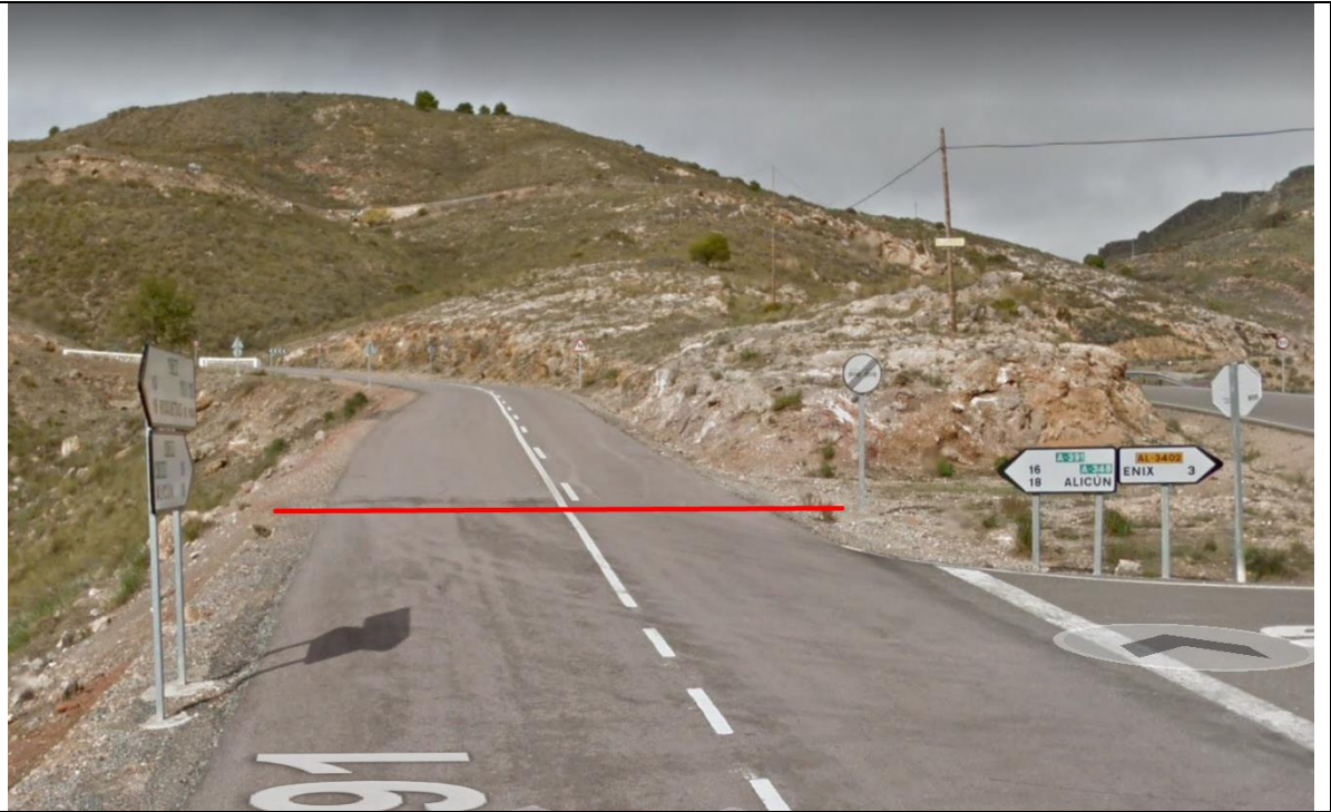
A-391 km 10,340 Intersección con AL-3402 (36.871722, -2.620933)

AUTOMÓVIL CLUB DE ALMERÍA · Av. Federico García Lorca, 42 - 04004 Almería · t 950265885 · m 615345054 · info@automovilclubdealmeria.com