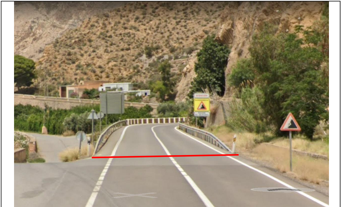
A-1075 km 13,800 (37.035067, -2.620910)

AUTOMÓVIL CLUB DE ALMERÍA · Av. Federico García Lorca, 42 - 04004 Almería · t 950265885 · m 615345054 · info@automovilclubdealmeria.com