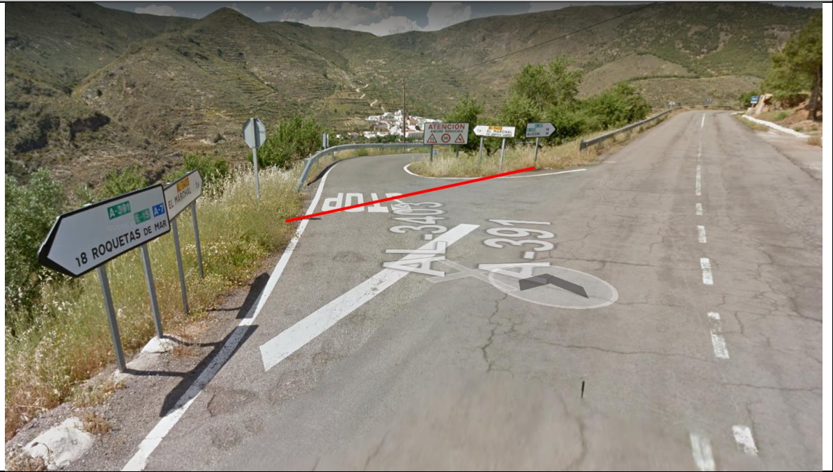
Acceso a ctra. AL-3403 km 0,000 Intersección con A-391 (36.885659, -2.626087)