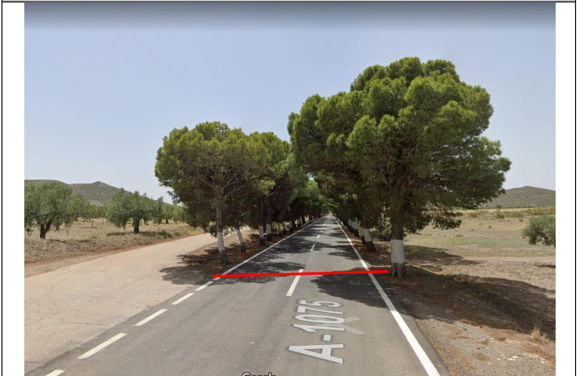
A-1075 km 21,750 (37.087151, -2.609805)