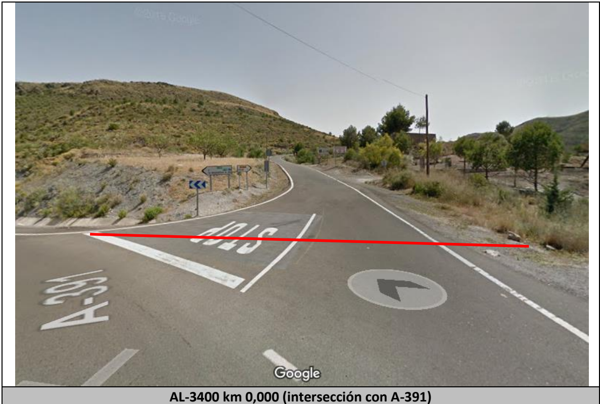
AL-3400 km 0,000 (intersección con A-391)