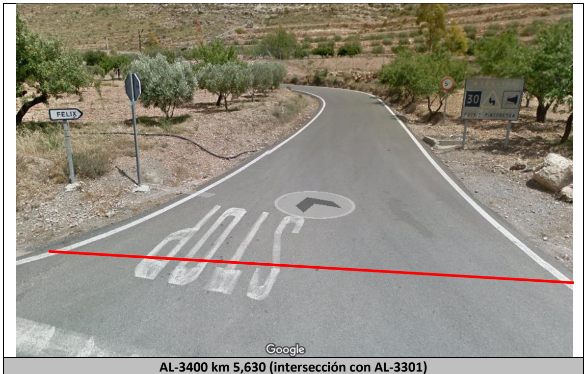
AL-3400 km 5,630 (intersección con AL-3301)